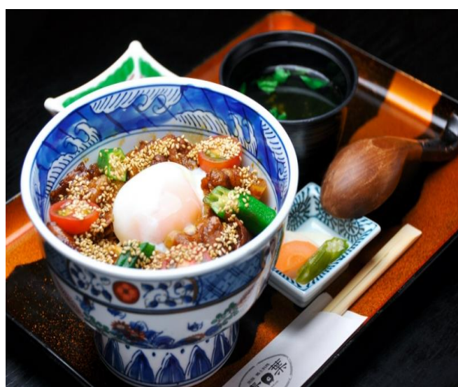
提供される料理例一：いぶすき黒豚丼