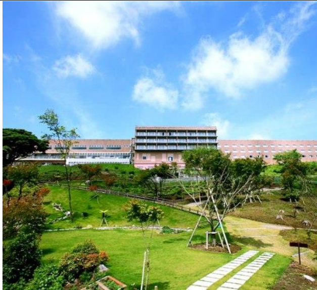
指宿ベイヒルズ外観

全体的に、清潔できれいなホテルです。砂蒸し風呂の体験もできます。お客様用レストランでも、食事をすることができます。レストランから鹿児島湾を見渡すことができます。食材は地元産を使っているなので、新鮮です。