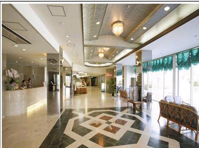
シーサイドホテルフロント