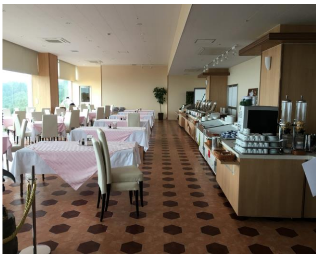
1 階レストラン内部（職員使用可）