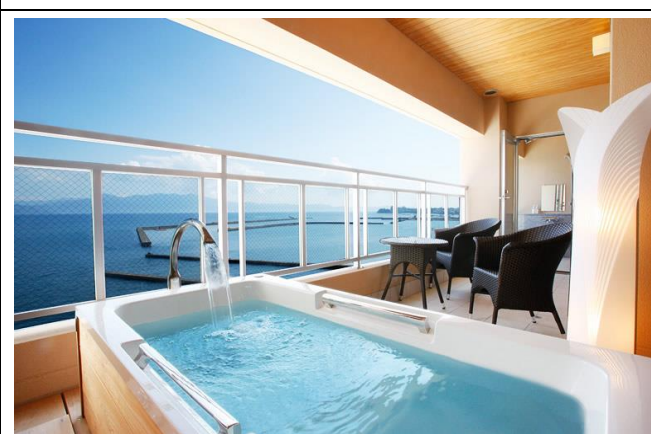
露天風呂付きの客室