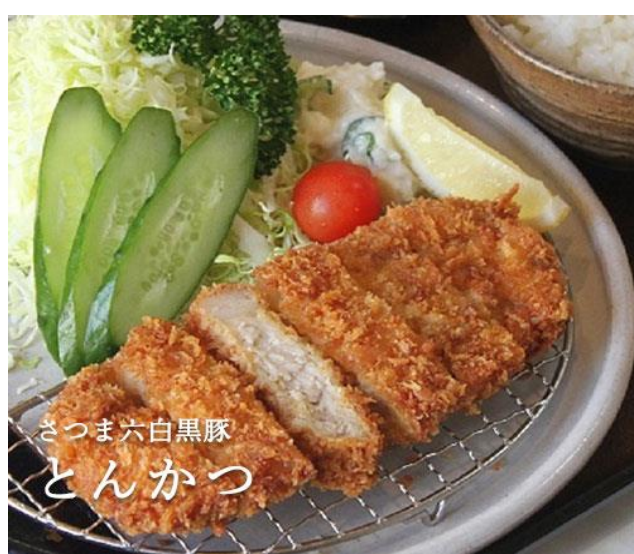
提供される料理例二：黒豚とんかつ