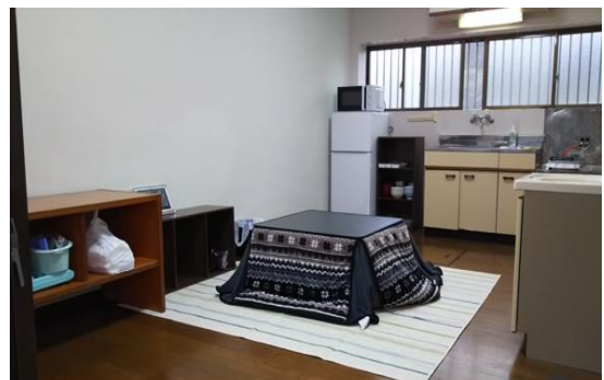
宿舍飯廳、客廳一角