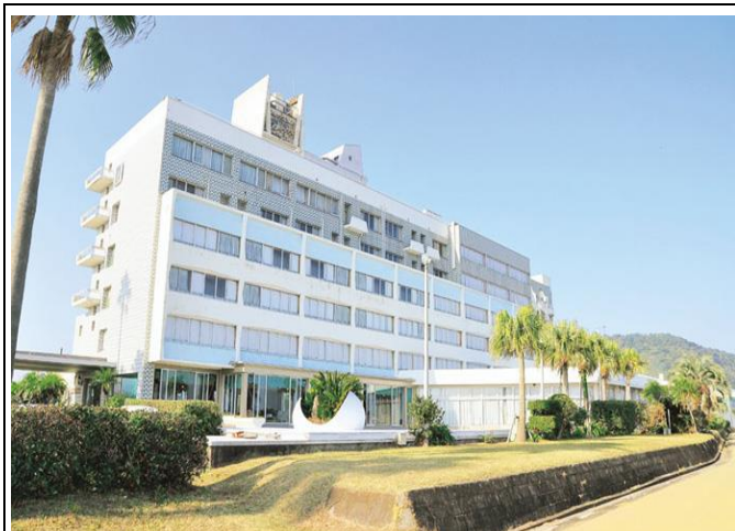
シーサイドホテル外観