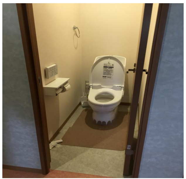
宿舎の清潔なトイレ