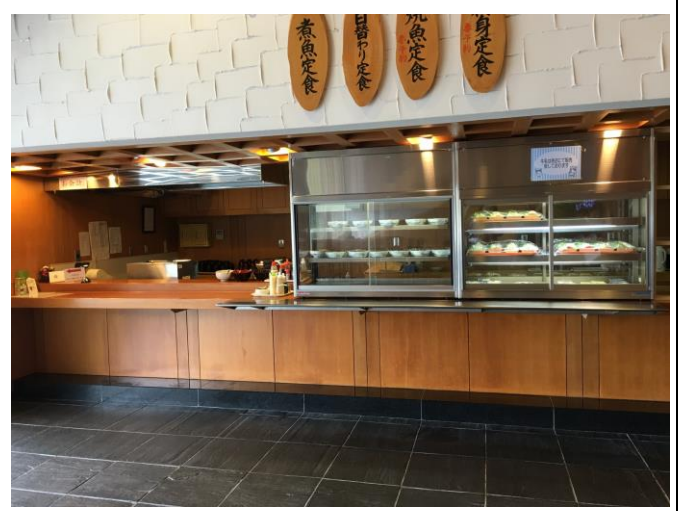
2 階レストラン内部（職員使用可）